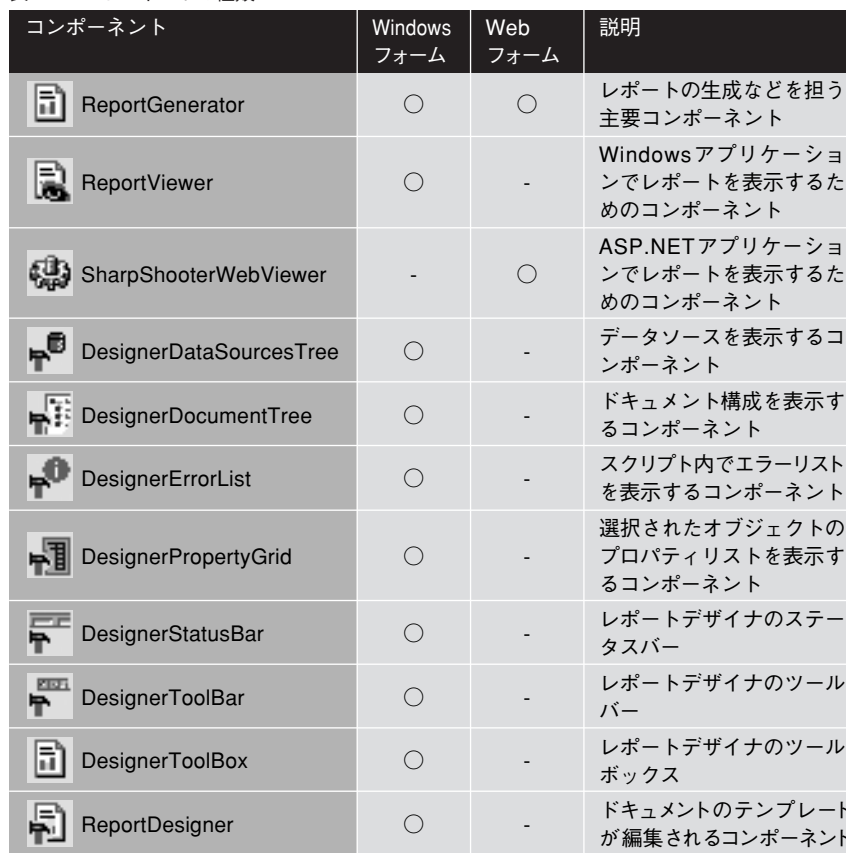
表2: コンポーネントの種類

類のエクスポートフィルタが提供されています。中核となるコンポーネントは、レポートの生成などを担うReport Generatorと、表示のためのReportViewer (WebアプリケーションではSharp ShooterWebViewer) です。これらのコンポーネントとテンプレート、データを用いて、図2のようにレポートを生成します。